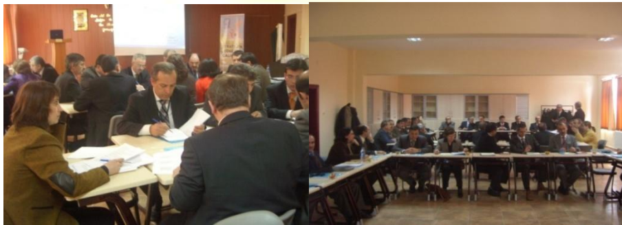
Tüside Çalıştayından Görüntüler