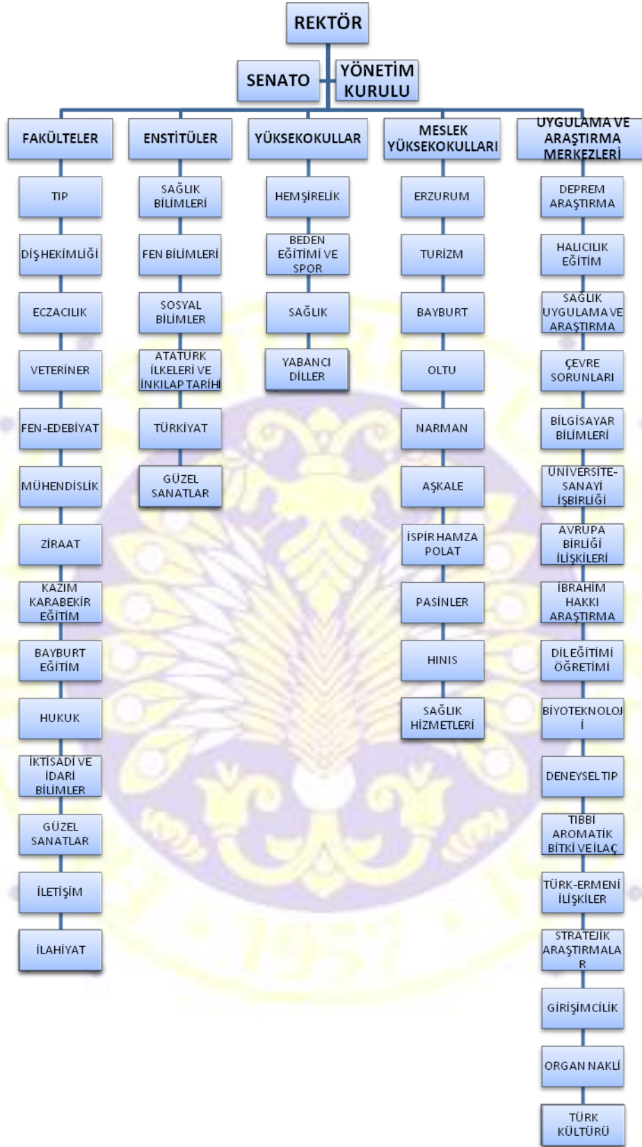
Atatürk Üniversitesi Akademik Kuruluş Şeması