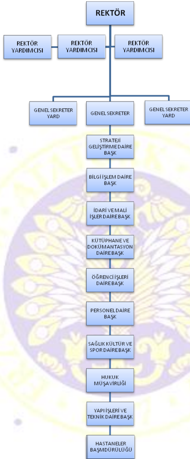
Atatürk Üniversitesi İdari Kuruluş Şeması